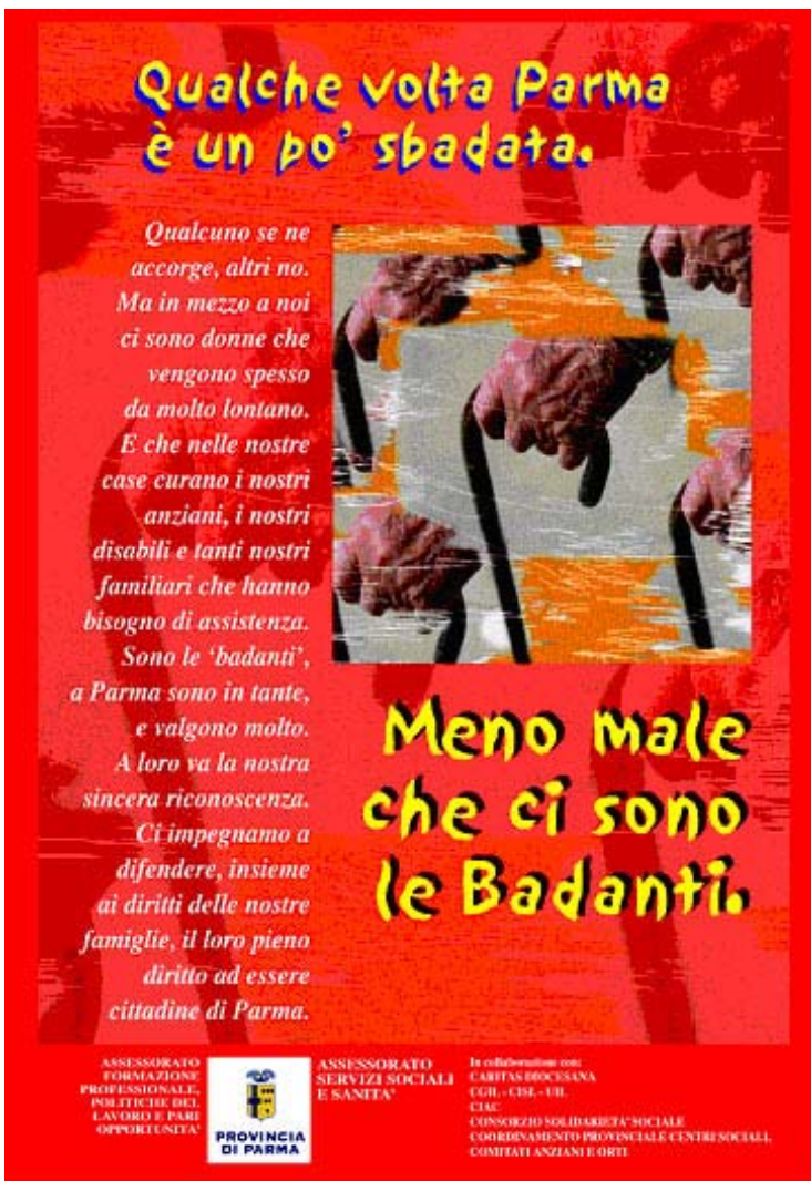
FIG. 4. Manifesto della Provincia di Parma.