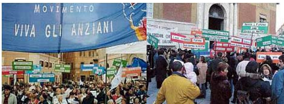
FIG. 1. Manifestazioni organizzate dall'associazione «Viva gli anziani» nel 2001-2002 per sollecitare la regolarizzazione dei lavoratori domestici «clandestini»

regolarizzazione delle persone di servizio «clandestine», manifestazione seguita da altre simili in diverse città italiane 1 (Fig. 1).