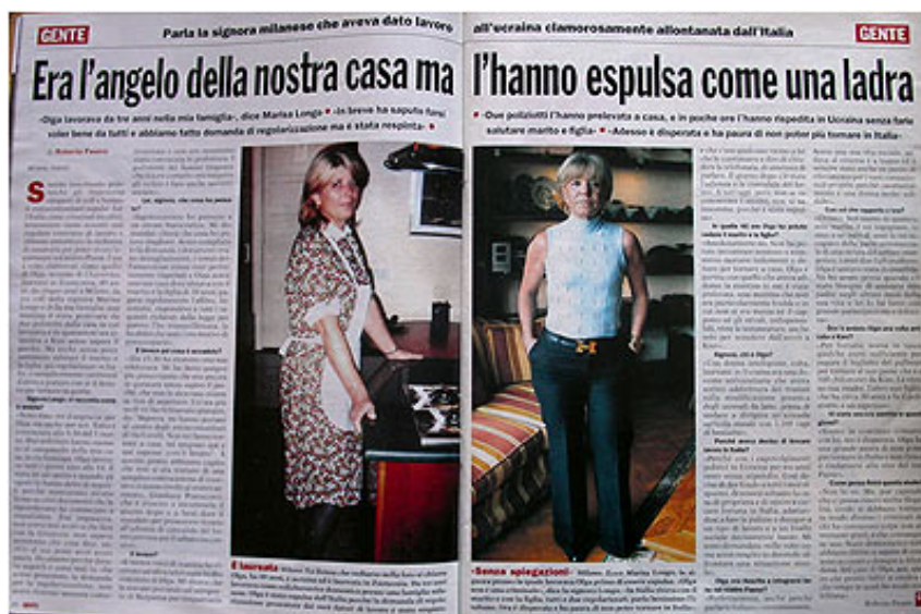
FIG. 2. Il caso di una badante ucraina, ex docente universitaria e dirigente, impiegata come colf a Milano la cui domanda di regolarizzazione è stata respinta

Ma l'attuale globalizzazione del servizio domestico ha rimesso in questione anche altre trasformazioni che sembravano per sempre acquisite, come la scomparsa dei domestici di estrazione sociale simile ai padroni e quella dei servitori che impiegavano a loro volta persone di servizio. Numerosi lavoratori domestici immigrati appartengono infatti ai ceti medi delle società di origine (Iref Acli-Colf 1999; Morini 2001; Cnel-Fondazione Silvano Andolfi 2003, 32-33). Questo in parte dipende